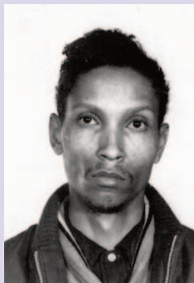
Politiefoto van Moseley.

Hij ontsnapte gedurende vijf dagen in maart 1968 en vroeg achttien keer tevergeefs voorwaardelijke vrijlating aan. Hij overleed in de Clinton Correctional Facility op 28 maart 2016 op 81-jarige leeftijd.